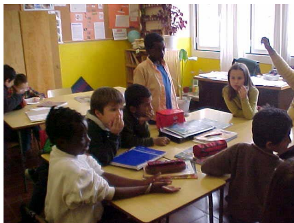
3. Conversa após a realização da experiência.

Depois da realização desta experiência, cujo resultado causou espanto, coloquei algumas questões para suscitar o diálogo e a troca de experiências entre os alunos: