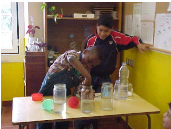
2. Execução da experiência.